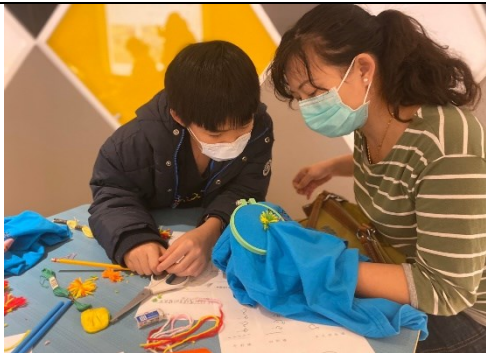
縫繡工作坊活動紀實

依照《消除對婦女一切形式歧視公約》，為提升女性的可見性及主體性，在活動「執行策略」上，活動宣傳及辦理期程搭配兒童節與母親節為，訴諸母性與親子關係。