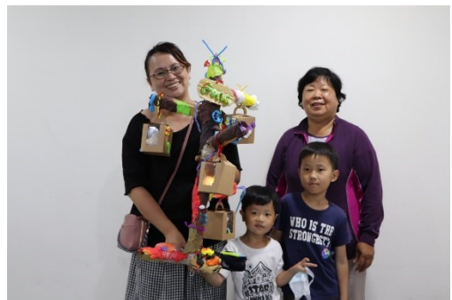
三代樂齡藝術共融工作坊活動紀實